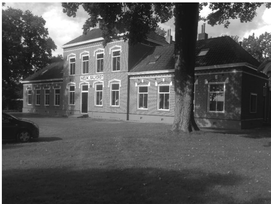
Het pand van de fam. Popken in 2014

op de stropers die plotseling een lichtbak op hen richtten en op marechaussee Vogel gingen schieten. Een vuurgevecht volgde en uiteindelijk werden de stropers gearresteerd. Eén van de stropers bleek tijdens het vuurgevecht gewond te zijn geraakt.