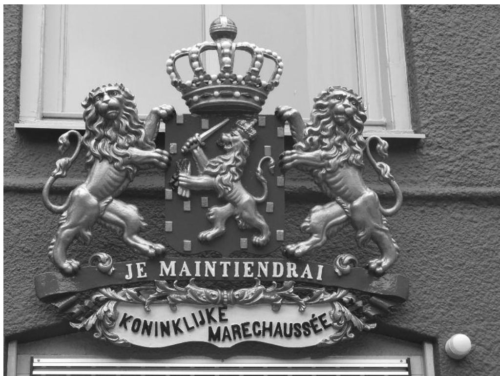
Het wapen op de vroegere Marechausseekazerne in Borger

Hijkersmilde een marechausseebrigade zal worden gevestigd. De locatie van het pand bij de Leembrug was ideaal voor de bereikbaarheid en surveillance van de Smildeger venen, maar ook in de richting van de veengebieden rondom Appelscha en richting Westerbork/Witteveen.